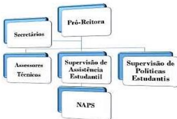
Figura 3. Organograma da Pró-Reitoria Estudantil